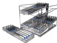
RACK PINZAS ROBÓTICAS